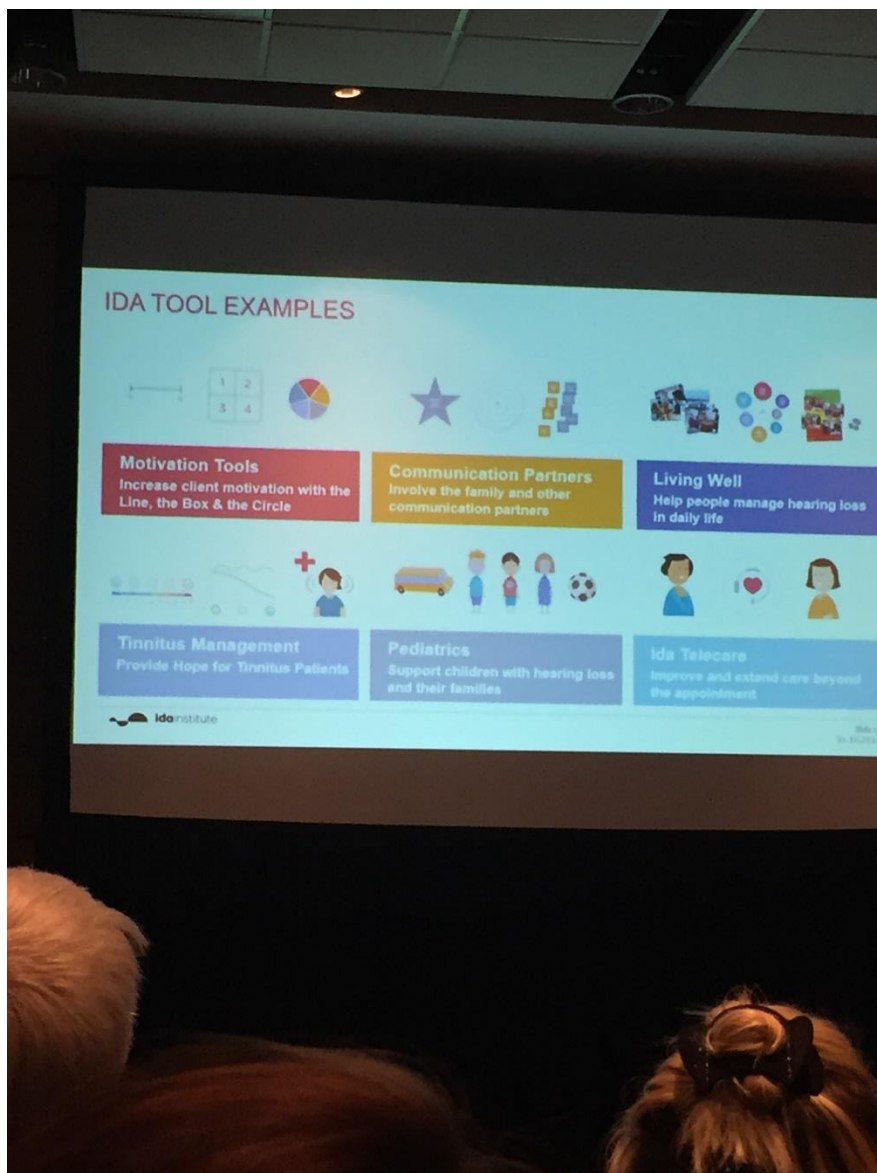
Bild från IDA-institutets föredrag