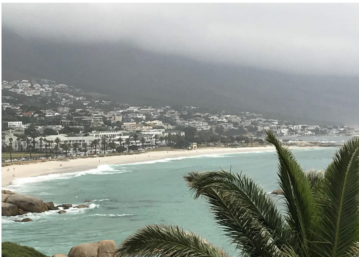
Kapstaden omges av berg och hav