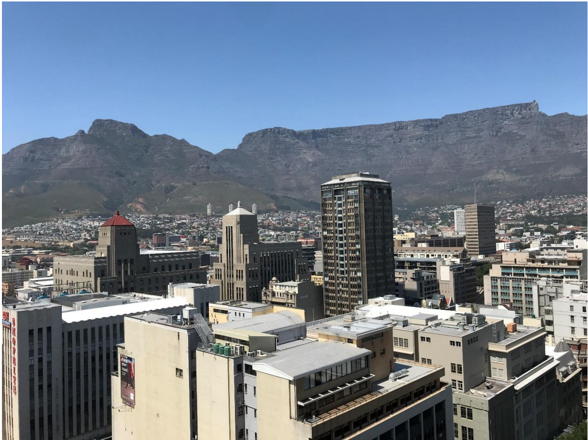
Utsikt från 19:e våningen på hotellet